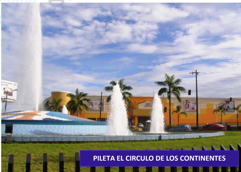
PILETA EL CIRCULO DE LOS CONTINENTES