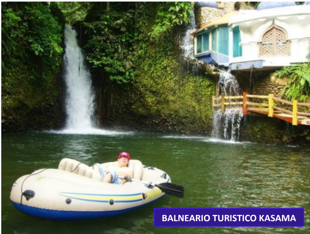
BALNEARIO TURISTICO KASAMA