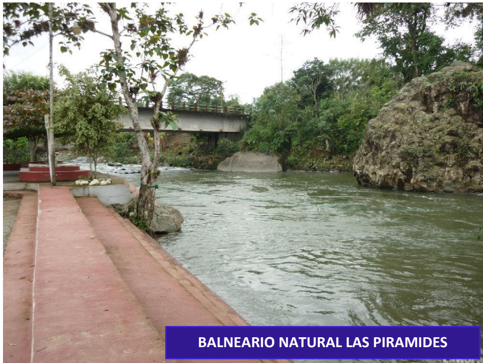
BALNEARIO NATURAL LAS PIRAMIDES