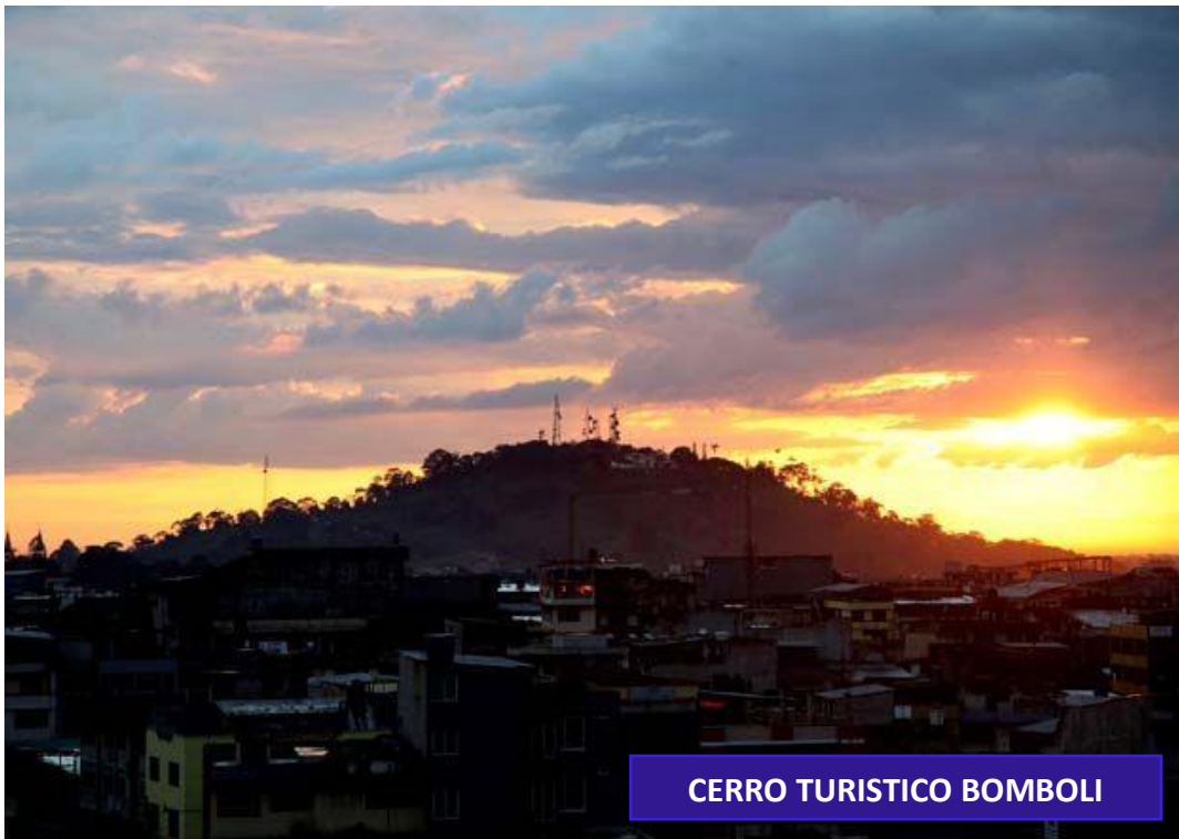
CERRO TURISTICO BOMBOLI